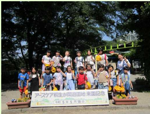
【2年生遠足 桐生が岡遊園地・動物園】