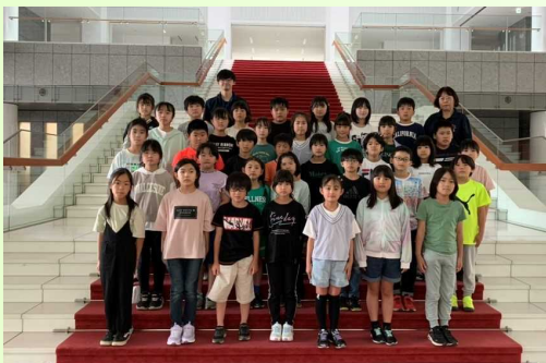
【4年生遠足 栃木県庁・防災館】